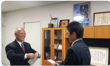
奈良市内の私立高校に結婚祝を届けに行きました。奈良教弘から結婚祝いをいただいたことを先生方に話しますと校長先生がおっしゃっていただきました。