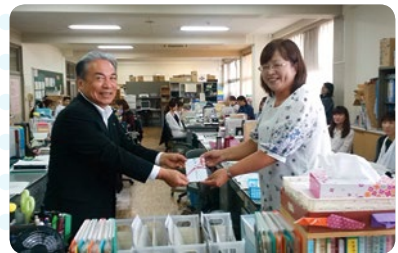
斑鳩町の小学校に「学校教育研究活動助成」に行ってきました。校長先生に助成金をお渡ししました。皆さん大変喜んでくれました。