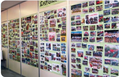
今年もチューリップの写真がたくさん届きました。それらを事務局内の壁面に張り出しました。

昨年(2016年)11月末に、奈良教弘がホームページにツイッターを立ち上げ、公益財団法人としての奈良教弘の活動をご紹介させていただいております。もうご覧になりましたか。私たちの活動を少しでもご理解いただければとこれからも発信してまいります。このページでは、花いっぱいプレゼントをはじめとする事業の様子をご紹介させていただきます。