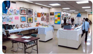
奈良県文化会館で開催中の「キラリと輝く特別支援学校アート展」に行ってきました。奈良教弘は、特別支援学校長会を通じて、この「アート展」を応援しています。