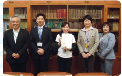
天理市内の小学校の先生にご結婚祝をもって伺いました。幸せいっぱいの先生笑顔がとても素敵でした。