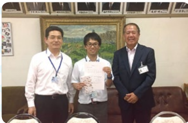
奈良市内の中学校に結婚祝をもって伺いました。明るく元気な笑顔が印象的な熱血先生とお見受けしました。