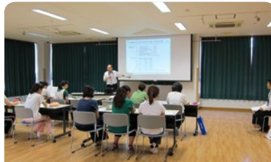
生駒郡のこども園で「年金早わかり講座」を開催しました。将来の生活の備えについてたくさんのお意見が出されました。