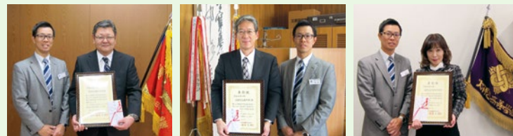
宇陀市立榛原中学校 広陵町立広陵中学校 奈良県立大宇陀高等学校