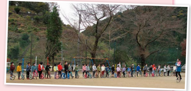
指導員の講習を受ける子どもたち

子どもたちは、ほとんどが一輪車を乗りこなし、当日の指導でテクニックにも更に磨きがかかり、生き生きとした表情で楽しんでいました。