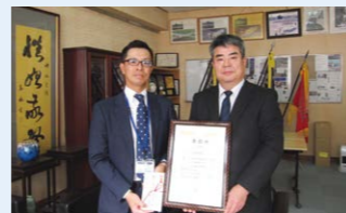
奈良県立郡山高等学校