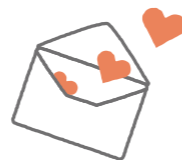
「おうち時間応援キャンペーン」のパンフレットです。