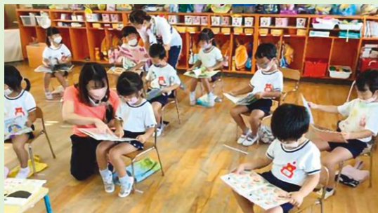
(※写真は別の幼稚園のものです)