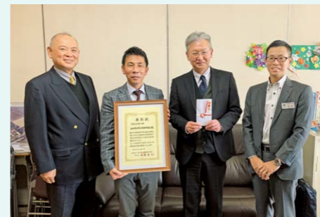
大和郡山市立片桐中学校