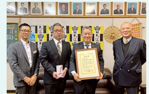
河合町立河合第一中学校